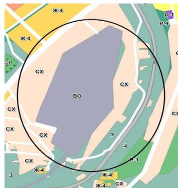
Фрагмент карты градостроительного зонирования до внесения изменений – существующая ситуация

Изменить территориальную зону ВО (зона размещения военных объектов) на территориальную зону Т (зона инженерной и транспортной инфраструктур), в отношении земельного участка с кадастровым № 51:28:0100004:23 (площадью 120 000 кв.м.), расположенного: Мурманская область, н.п.Зашеек.