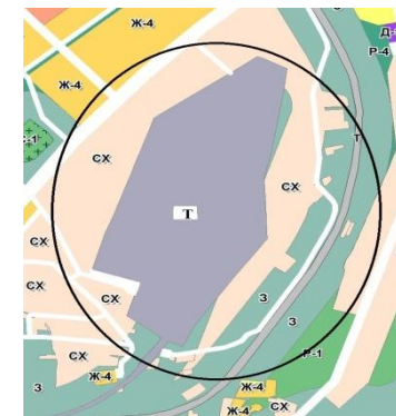
Фрагмент карты градостроительного зонирования после внесения изменений