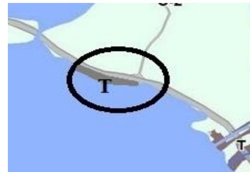
Фрагмент карты градостроительного зонирования после внесения изменений