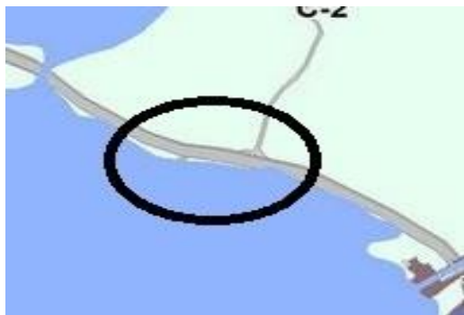
Фрагмент карты градостроительного зонирования до внесения изменений – существующая ситуация

Изменить (частично) территорию земель лесного фонда (категория земель – земли промышленности, энергетики, транспорта, связи, радиовещания, телевидения, информатики, земли для обеспечения космической деятельности, земли обороны, безопасности и земли специального назначения) на территориальную зону Ж-Т (зона инженерной и транспортной инфраструктур) в отношении земельных участков с кадастровыми № 51:29:0010001:127 (площадью 15 600 кв.м.), № 51:29:0010001:133 (площадью 16 200 кв.м.) расположенных: Мурманская область, муниципальное образование г.Полярные Зори с подведомственной территорией.